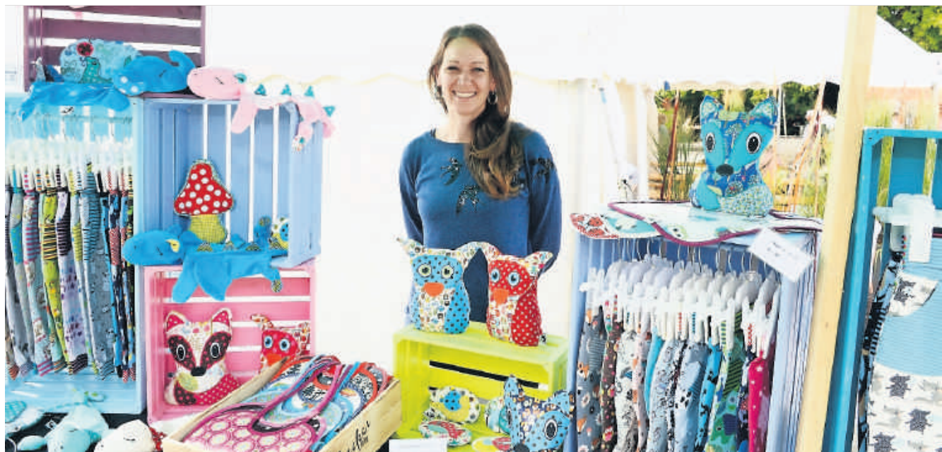
Rund 30 Marktstände ergänzten das Rahmenprogramm auf dem Areal der Martin Stiftung.

Die Überraschungen gingen noch weiter, als der Chor der Martin Stiftung und später die Trommelgruppe, jeweils verstärkt durch die Bevölkerung, mit grosser Leidenschaft ihre Vorführungen präsentierten. Ausserhalb des Festzelts herrschte rund um die 30 Marktstände ein reges Treiben, und so manch ein Festbesucher verliess das Areal mit einem Lächeln auf dem Gesicht.